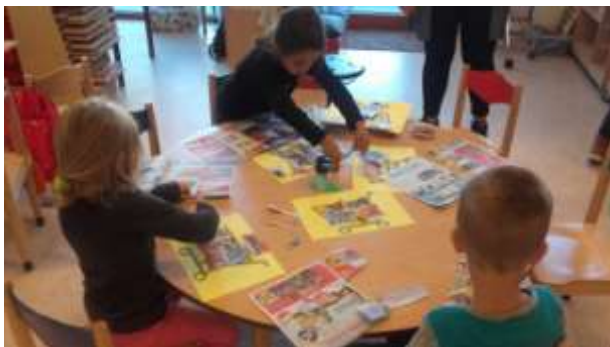
Knippen en plakken voor ons winkelwagentje.