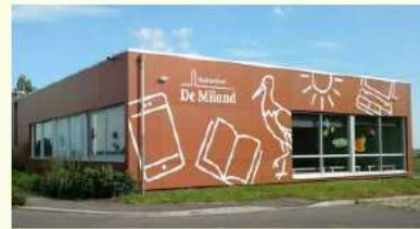
Een school met ongeveer 50 leerlingen in het midden van het Groene Hart met een open karakter.

De basisscholen de Willibrord en de Miland bieden passend onderwijs voor ieder kind en hanteren hierbij 3 speerpunten: