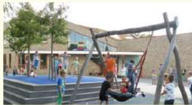
Een school met 400 leerlingen, een modern gebouw en sterke verbinding met de omgeving.